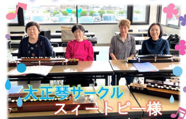
大正琴サークル スイートピー様

貸室ご利用の際に記入して頂く「利用承認書兼領収書」のナンバーがラッキー又はシークレットナンバーに当選された団体様へ、プレゼントをお渡ししています!今回はシークレットナンバー104番、スイートピー様が当選されました!いつもご利用頂きありがとうございます♪